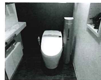
▲バブルケア自動泡出機設置例