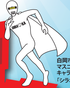
白岡市 マスコット キャラクター 「シラオ仮面」